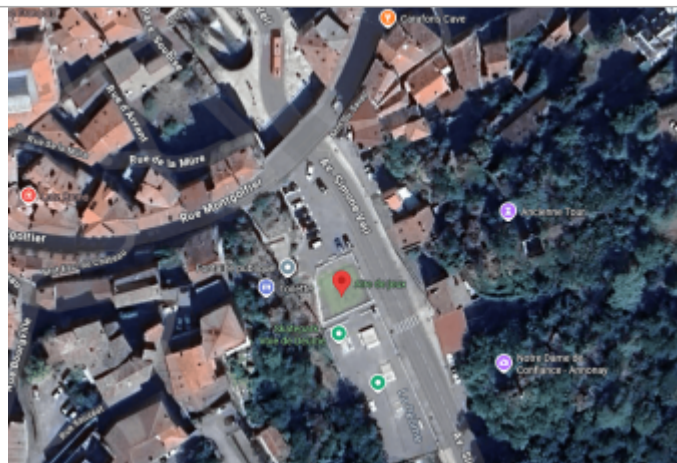
Vue du site, 2024. Vue globale