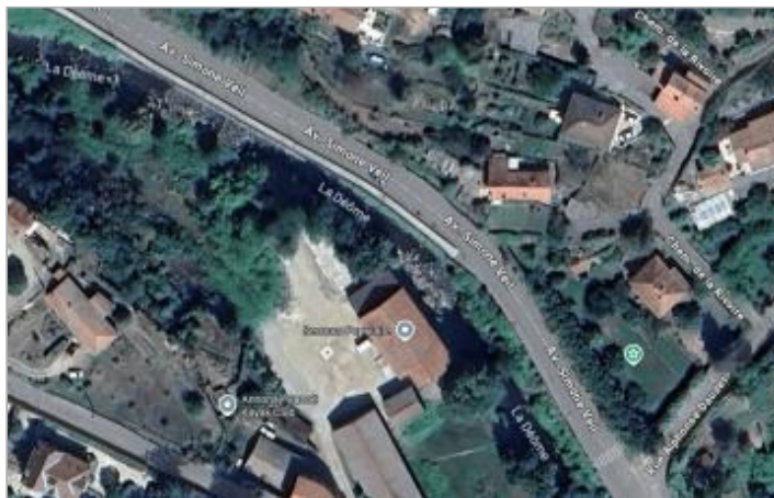
Vue du site, 2024. Vue globale : source google map (2026)