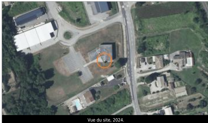
Vue du site, 2024.