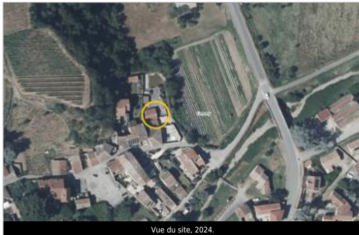
Vue du site, 2024.