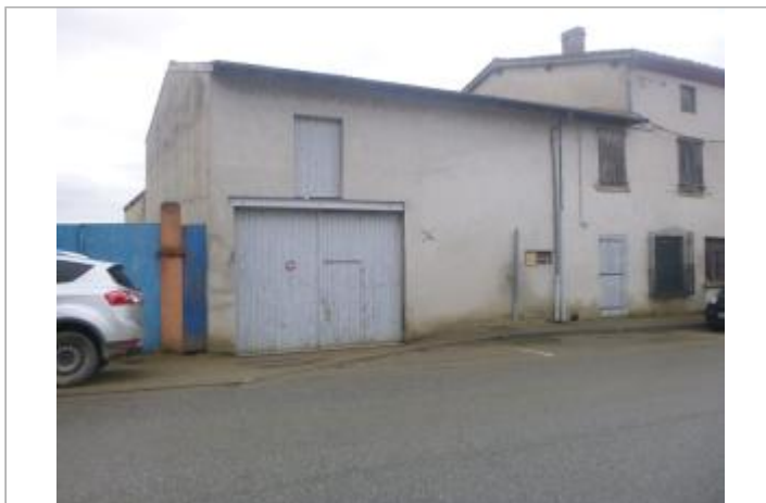
Vue du site, 2024.