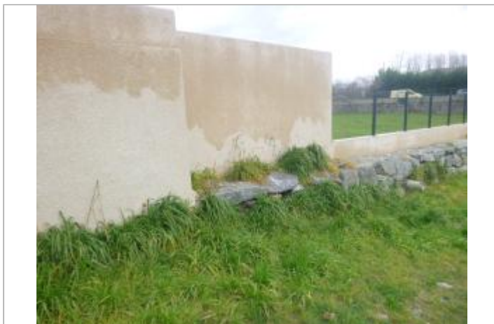
Vue du site, 2024.