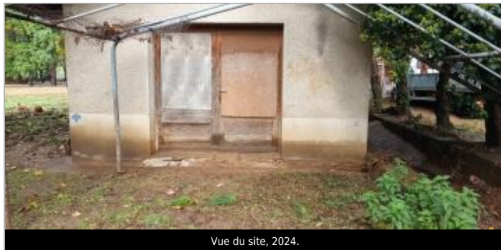
Vue du site, 2024.