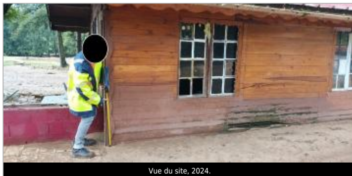
Vue du site, 2024.