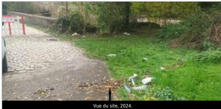
Vue du site, 2024.