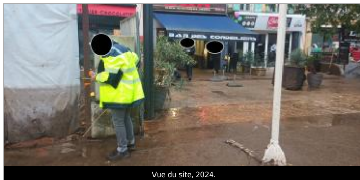
Vue du site, 2024.