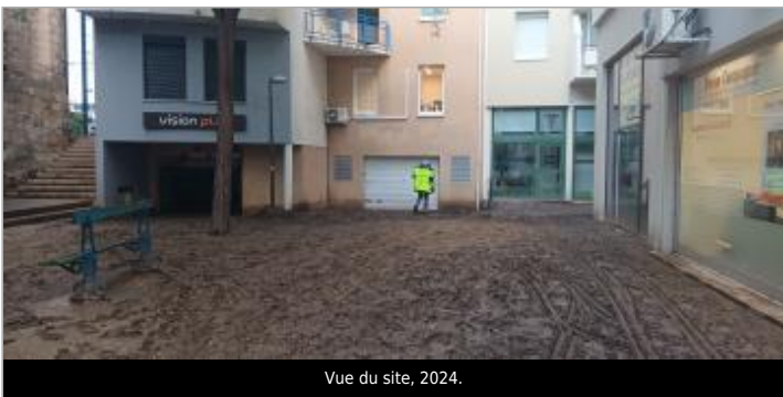
Vue du site, 2024.

GÉOLOCALISATION Coordonnées WGS84 : X: 4.67171675 / Y: 45.24240260 Coordonnées RGF93 (Lambert 93) X: 831150.48 / Y: 6461728.92 Coordonnées RGF93 (ETRS89) : X: 4.6717168 / Y: 45.2424026 Code Hydro: V3510500 Rive de référence: Non renseigné