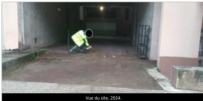
Vue du site, 2024.