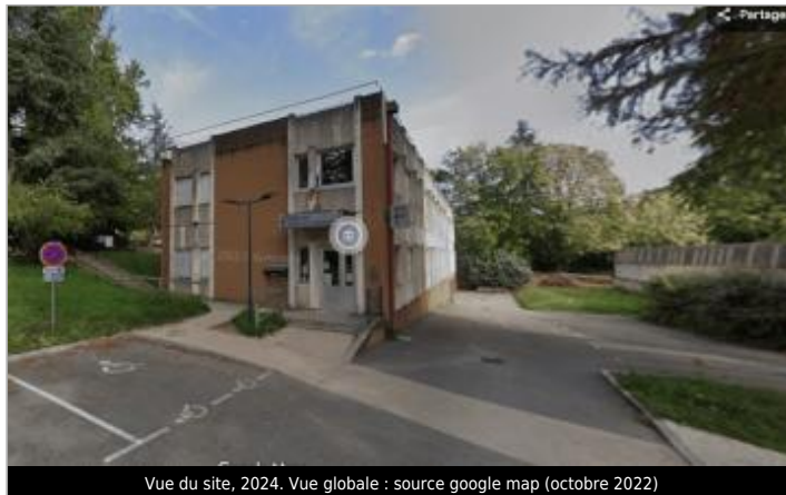
Vue du site, 2024. Vue globale : source google map (octobre 2022)