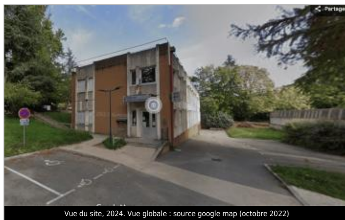
Vue du site, 2024. Vue globale : source google map (octobre 2022)

GÉOLOCALISATION Coordonnées WGS84 : X: 4.66968819 / Y: 45.24547200 Coordonnées RGF93 (Lambert 93) X: 830984.15 / Y: 6462066.35 Coordonnées RGF93 (ETRS89) : X: 4.6696882 / Y: 45.245472 Code Hydro: V3510500 Rive de référence: Non renseigné