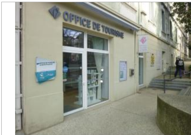
Vue du site, 2024.