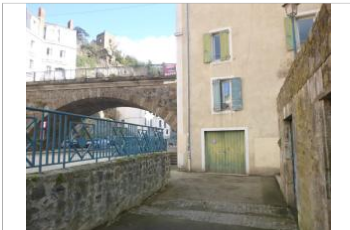
Vue du site, 2024.