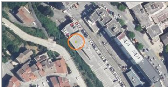
Vue du site, 2024.