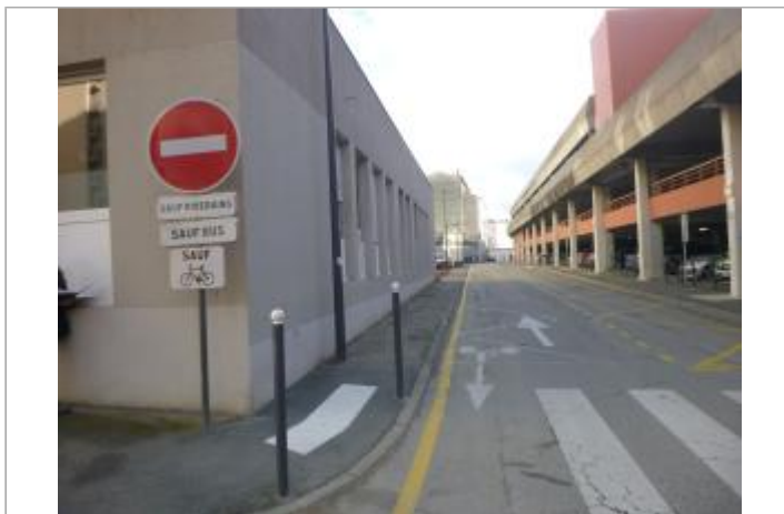
Vue du site, 2024.