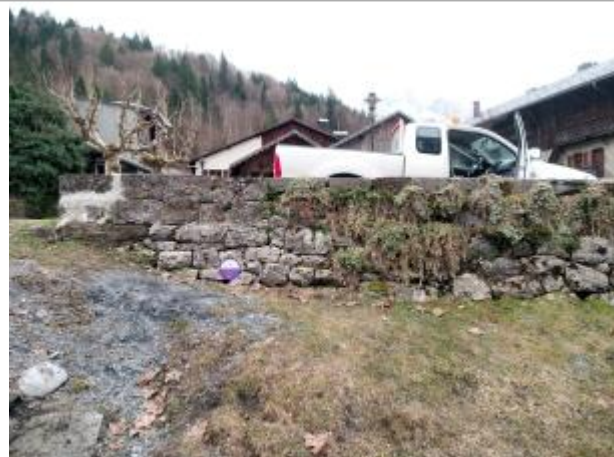
Mur aval pont de la mairie