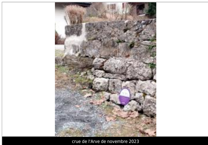
crue de l'Arve de novembre 2023