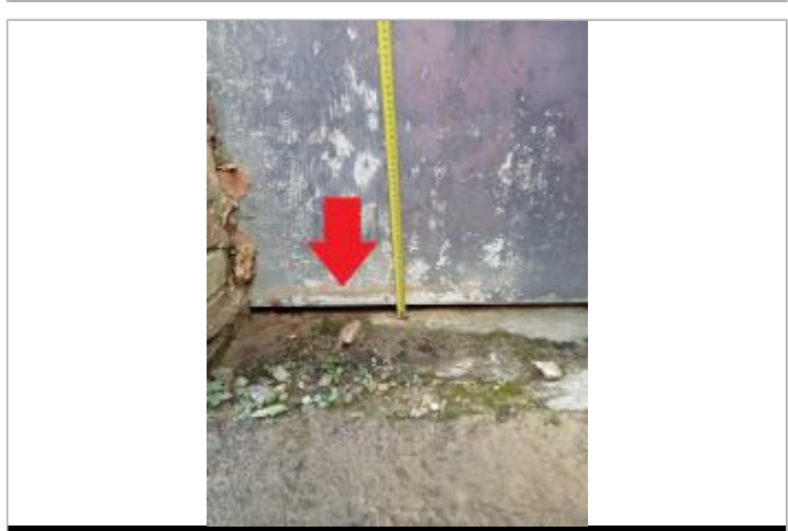
Laisse de crue à 6 cm/ sol au pied de la porte.

MARQUE Maximum de l'inondation : Oui Visibilité : Oui État du repère : Moyen Pérennité : Moyenne Repère calculé : Non PHEC : Non renseigné