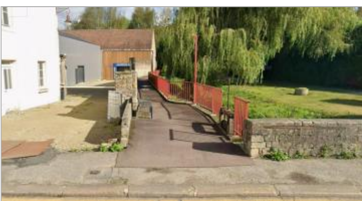
Vue du Chemin promenade de la rue Saint-Roch depuis la rue St-Roch.

GÉOLOCALISATION Coordonnées WGS84 : X: -1.63704607 / Y: 49.47112760 Coordonnées RGF93 (Lambert 93) X: 363969.78 / Y: 6940062.45 Coordonnées RGF93 (ETRS89) : X: -1.6370461 / Y: 49.4711276 Code Hydro: I50-0400 Rive de référence: Droite