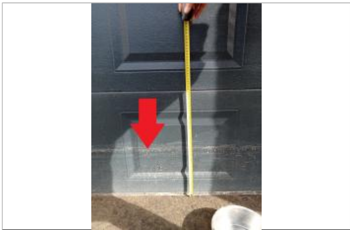
Laisse de crue de 25 cm sur porte du garage au n°9 bis

MARQUE Maximum de l'inondation : Oui Visibilité : Oui État du repère : Moyen Pérennité : Aucune Repère calculé : Non renseigné PHEC : Non renseigné