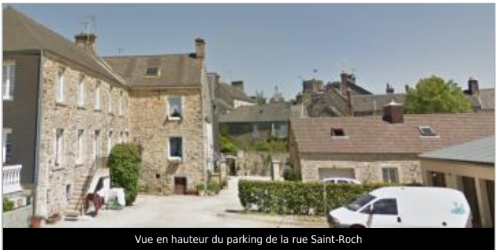
Vue en hauteur du parking de la rue Saint-Roch

GÉOLOCALISATION Coordonnées WGS84 : X: -1.63692951 / Y: 49.47047010 Coordonnées RGF93 (Lambert 93) X: 363973.92 / Y: 6939988.92 Coordonnées RGF93 (ETRS89) : X: -1.6369295 / Y: 49.4704701 Code Hydro: I50-0400 Rive de référence: Gauche