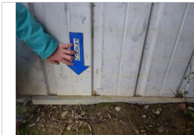
laisse de crue marquée sur le support

Altitude calculée de l'eau (en m) : 63.5 m