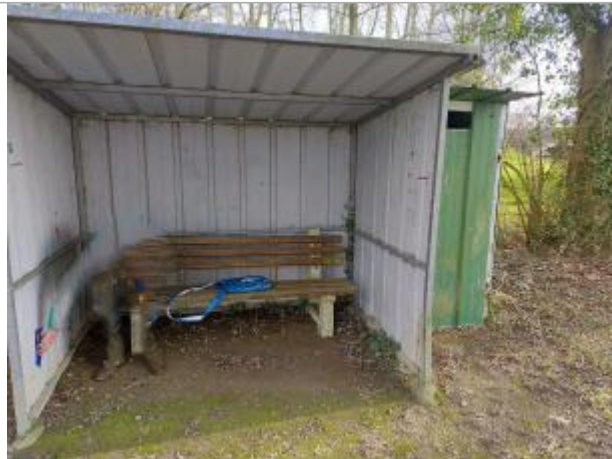
abri-bus présent sur le site