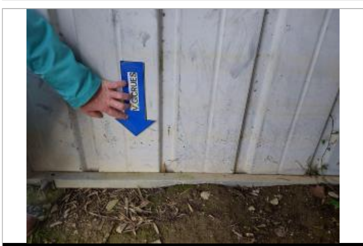
laisse de crue marquée sur le support

MARQUE Maximum de l'inondation : Oui Visibilité : Oui État du repère : Bon Pérennité : Moyenne