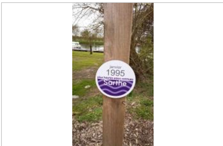
Vue sur le repère