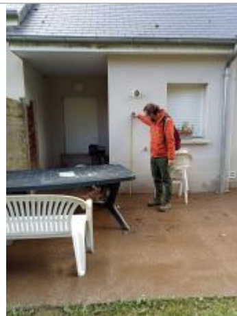
Terrasse sur l'arrière du n°12 résidence de la Chaussée à proximité de la porte arrière