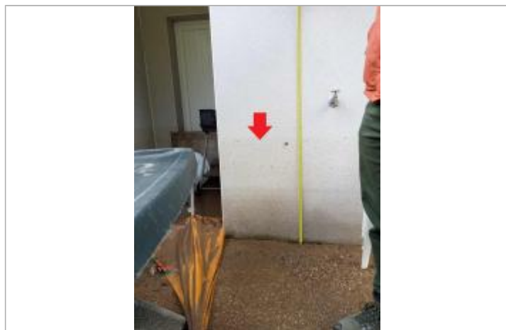
Laisse de 69 cm à l'arrière du n°12