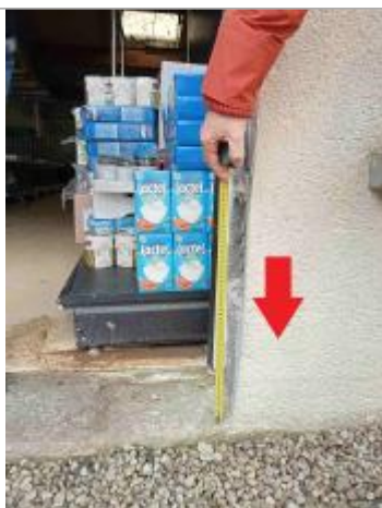
Laisse de crue de 20 cm sur le côté droit du garage

Maximum de l'inondation : Oui Visibilité : Non État du repère : Mauvais Pérennité : Aucune Repère calculé : Non renseigné PHEC : Non renseigné