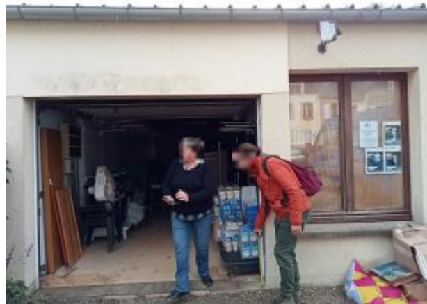
Côté droit de la porte du garage vue de face