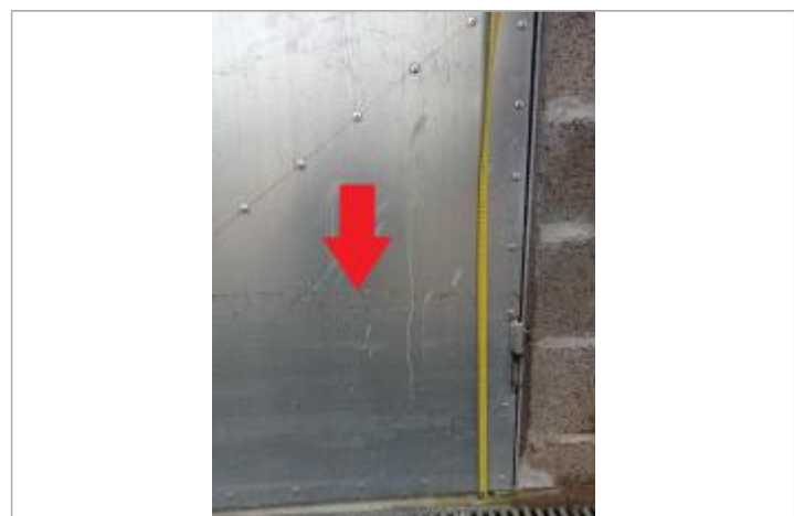
Laisse de crue de 43 cm sur porte de garage

MARQUE Texte : Laisse de crue pris par rapport au sol Maximum de l'inondation : Oui Visibilité : Oui État du repère : Moyen Pérennité : Aucune Repère calculé : Non renseigné PHEC : Non renseigné