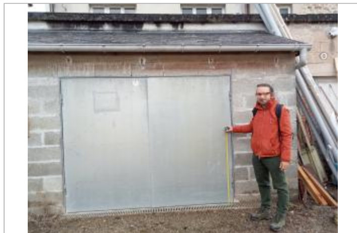
Prise de vue de la cour intérieure vers l'arrière du n°6

GÉOLOCALISATION Coordonnées WGS84 : X: -1.63717919 / Y: 49.47091220 Coordonnées RGF93 (Lambert 93) X: 363958.74 / Y: 6940039.09 Coordonnées RGF93 (ETRS89) : X: -1.6371792 / Y: 49.4709122 Code Hydro: I50-0400 Rive de référence: Gauche