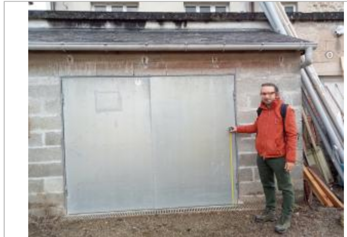
Prise de vue de la cour intérieure vers l'arrière du n°6