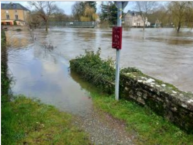
Le Lavoir - Saint Laurent sur Sèvre - photo 1