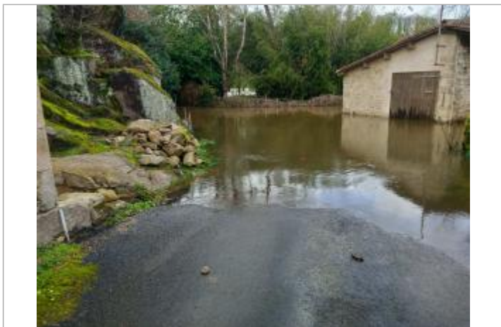
Crue février 2026 - Sèvre Nantaise - Tiffauges - photo 1

Texte : Sèvre Nantaise - Tiffauges - Le Rouet : crue février 2026 Maximum de l'inondation : Oui