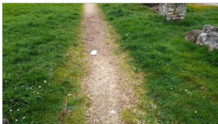
Vue de la laisse, SPC VCA, 2026