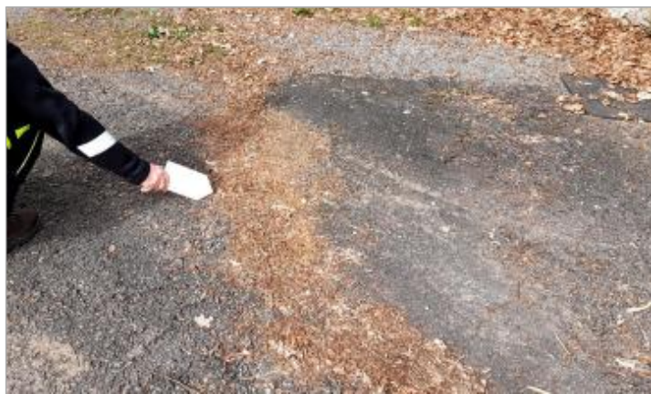
Vue de la laisse, SPC VCA, 2026