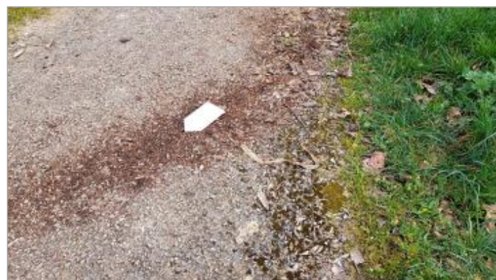
Vue de la laisse - SPC VCA - 2026

GÉNÉRAL Code : 26VCASN26_R_11_1 Date de mise à jour : 26/03/2026 Auteur : SPC VCA