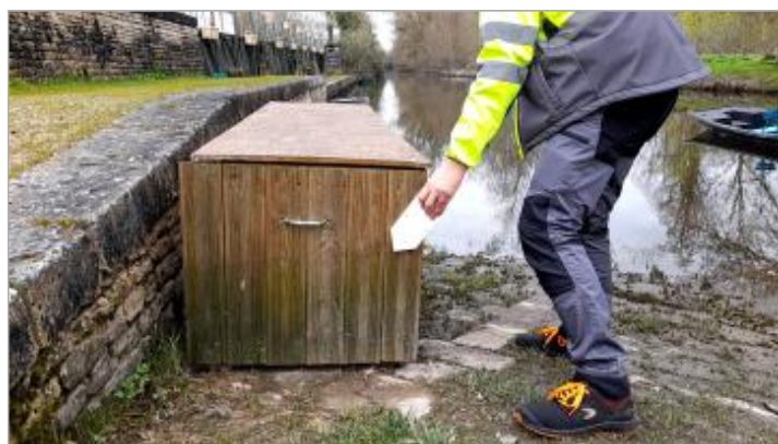
Vue de la laisse - SPC VCA - 2026