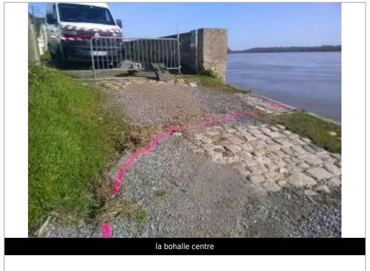
la bohalle centre

GÉOLOCALISATION Coordonnées WGS84 : X: -0.39901916 / Y: 47.41983420 Coordonnées RGF93 (Lambert 93) X: 443807 / Y: 6707680 Coordonnées RGF93 (ETRS89) : X: -0.3990192 / Y: 47.4198342 Code Hydro: Rive de référence: Droite