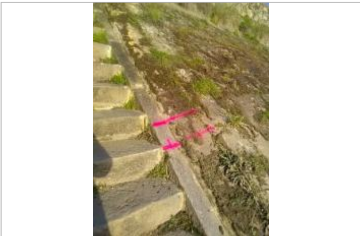
st clement centre

GÉOLOCALISATION Coordonnées WGS84 : X: -0.18648458 / Y: 47.33118150 Coordonnées RGF93 (Lambert 93) X: 459420 / Y: 6697172 Coordonnées RGF93 (ETRS89) : X: -0.1864846 / Y: 47.3311815 Code Hydro: Rive de référence: Droite