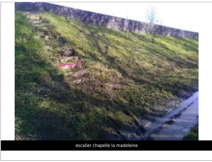
escalier chapelle la madeleine

GÉOLOCALISATION Coordonnées WGS84 : X: -0.13104620 / Y: 47.30497710 Coordonnées RGF93 (Lambert 93) X: 463488 / Y: 6694096 Coordonnées RGF93 (ETRS89) : X: -0.1310462 / Y: 47.3049771 Code Hydro: Rive de référence: Droite