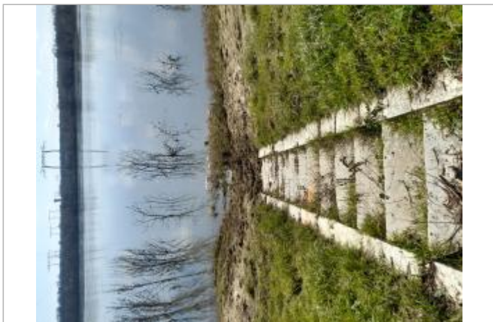
marquage CA SVL, escalier 18-20

Maximum de l'inondation : Oui Visibilité : Oui État du repère : Moyen Pérennité : Moyenne