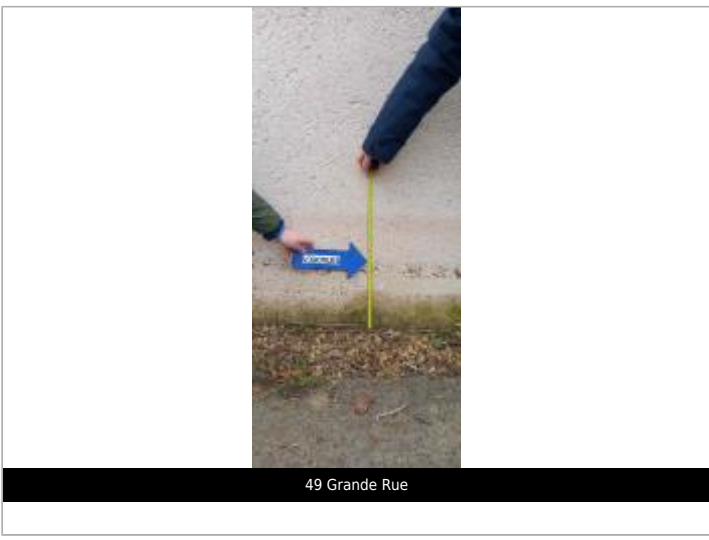
49 Grande Rue

GÉOLOCALISATION Coordonnées WGS84 : X: -0.50618240 / Y: 47.56711890 Coordonnées RGF93 (Lambert 93) X: 436461.34 / Y: 6724379.05 Coordonnées RGF93 (ETRS89) : X: -0.5061824 / Y: 47.5671189 Code Hydro: Rive de référence: Gauche