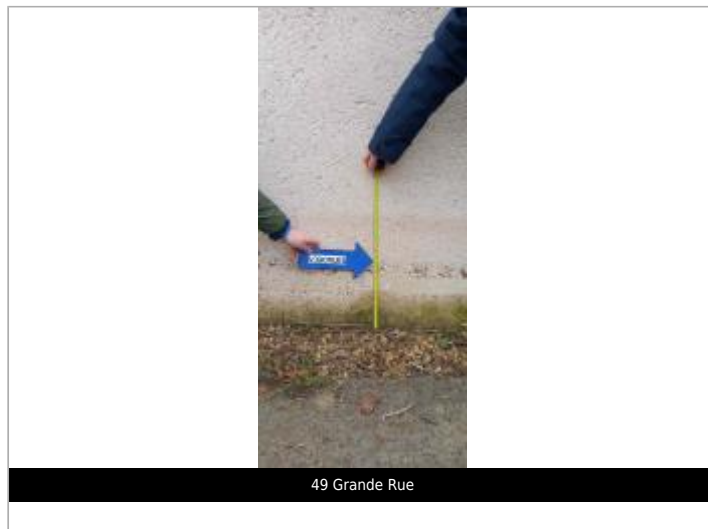
49 Grande Rue