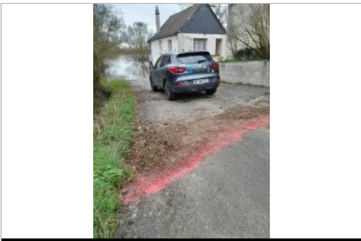
2 Rue Seyeux Vérigné

GÉOLOCALISATION Coordonnées WGS84 : X: -0.49414623 / Y: 47.58847350 Coordonnées RGF93 (Lambert 93) X: 437470.38 / Y: 6726709.03 Coordonnées RGF93 (ETRS89) : X: -0.4941462 / Y: 47.5884735 Code Hydro: Rive de référence: Gauche