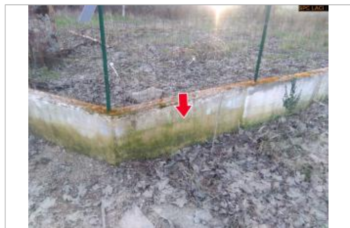
Vue du repère en 2026