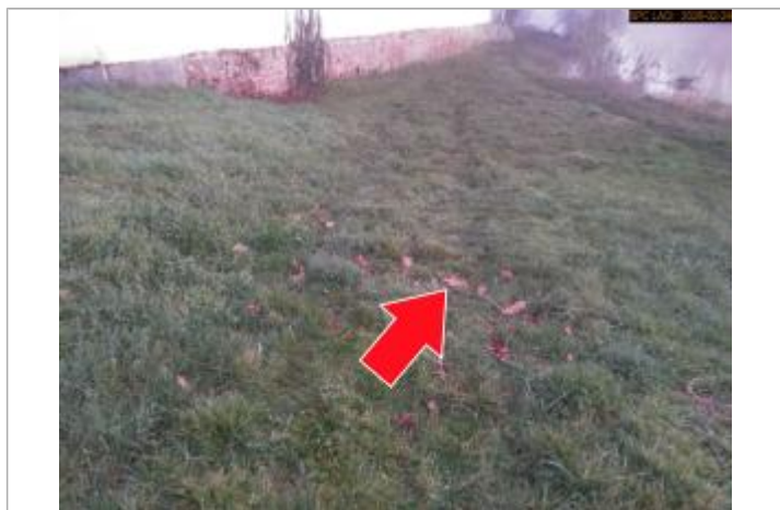
Vue du repère en 2026