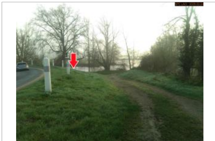
Vue du site en 2026