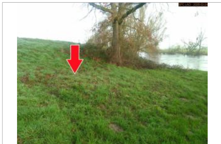
Vue du repère en 2026