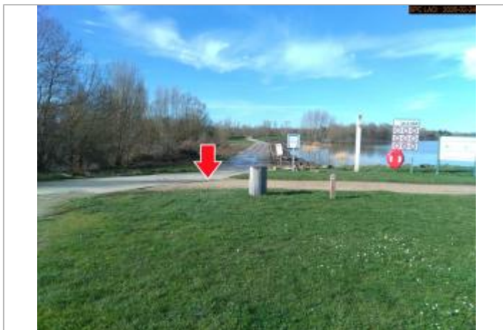
Vue du site en 2026