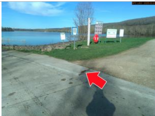
Vue du repère en 2026

Altitude calculée de l'eau (en m) : 151.774 m