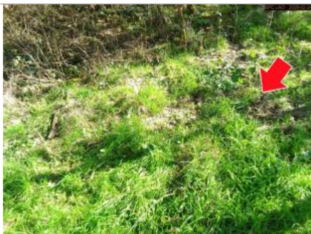
Vue du repère en 2026

Altitude calculée de l'eau (en m) : 141.685 m