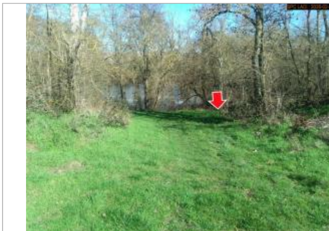
Vue du site en 2026