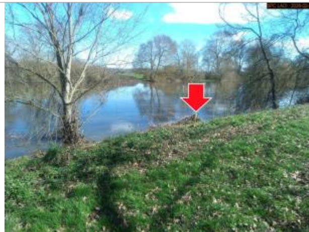
Vue du site en 2026