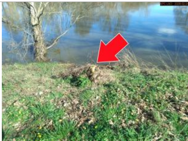
Vue du repère en 2026

SOURCE DE REPÉRAGE : SPC LACI, LE CHER BERRICHON, CRUE DE FÉVRIER 2026 - 24/02/2026