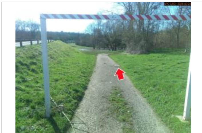
Vue du site en 2026