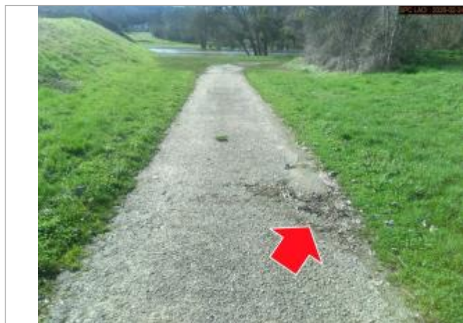
Vue du repère en 2026

SOURCE DE REPÉRAGE : SPC LACI, LE CHER BERRICHON, CRUE DE FÉVRIER 2026 - 24/02/2026