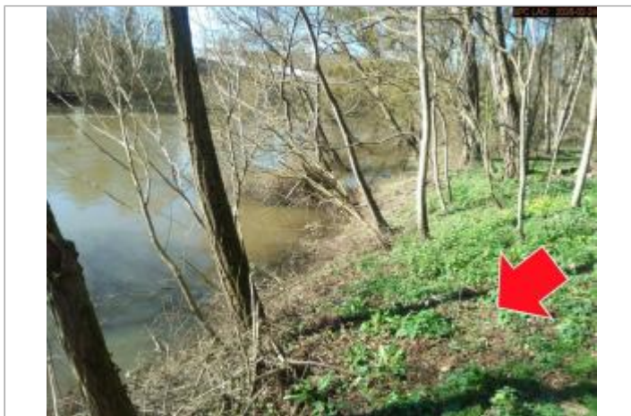
Vue du site en 2026