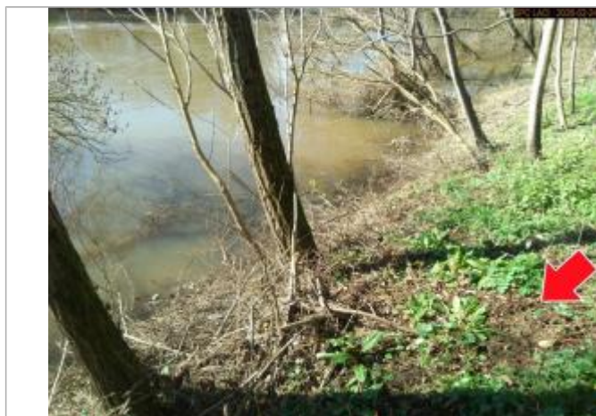
Vue du repère en 2026