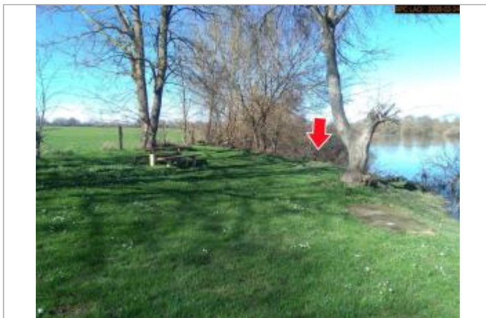
Vue du site en 2026