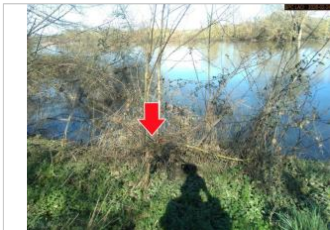
Vue du repère en 2026

SOURCE DE REPÉRAGE : SPC LACI, LE CHER BERRICHON, CRUE DE FÉVRIER 2026 - 24/02/2026