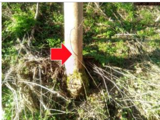
Vue du repère en 2026

SOURCE DE REPÉRAGE : SPC LACI, LE CHER BERRICHON, CRUE DE FÉVRIER 2026 - 24/02/2026