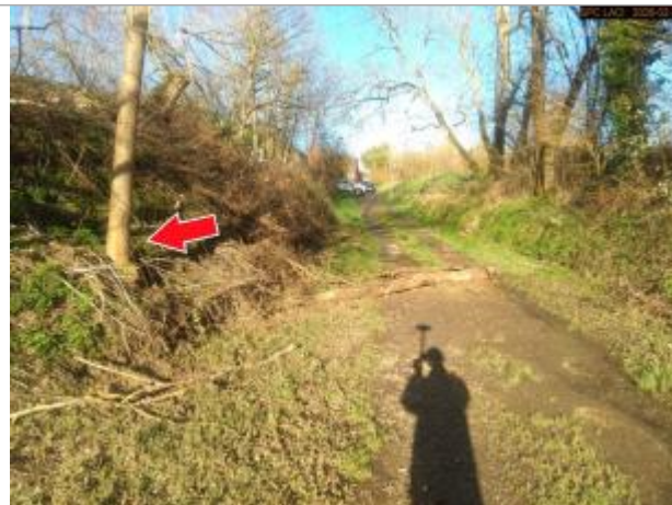
Vue du site en 2026